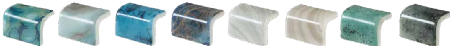
STEP 5607 NATURE SKY * STEP 5606 NATURE AIR FORCE * STEP 5605 NATURE OLYMPIC * STEP 5604 NATURE ROYAL * STEP 5600 NATURE PEARL RIVER * STEP 5601 NATURE SEA SALT * STEP 5606 NATURE BALI * STEP 5603 NATURE JUNGLE *