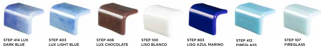
STEP 414 LUX DARK BLUE STEP 403 LUX LIGHT BLUE STEP 406 LUX CHOCOLATE STEP 100 LISO BLANCO STEP 803 LISO AZUL MARINO STEP 412 FIREGLASS STEP 107 FIREGLASS